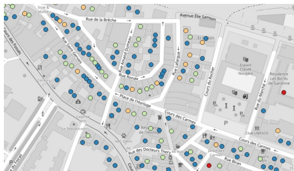
FrancePop © bati - Répartition de la population à l'immeuble

Ces différentes granularités vous permettent d'exploiter plus facilement les données disponibles :